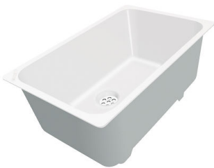
Weiße Wanne 8153 100